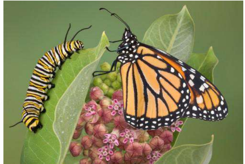
El gusano se convirtió en mariposa