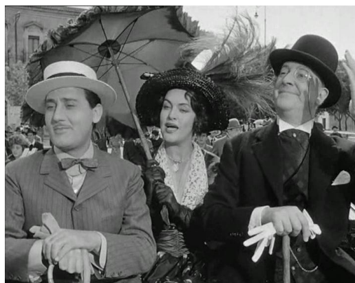
(L'arte di arrangiarsi, 1954)

7 Os italianos são um povo criativo, com muitos poetas, escultores, pintores e escritores como Michelangelo, Botticelli, Caravaggio ou Dante. A criatividade italiana é também "a arte de se virar".